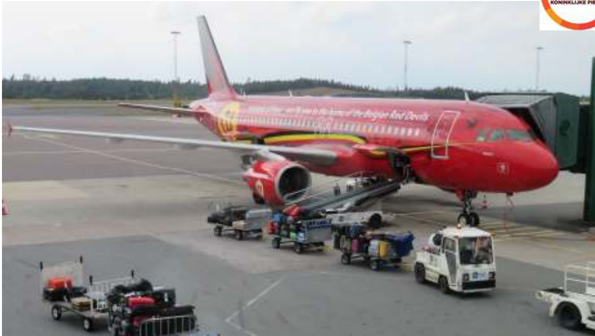
DE KPSK-BAGAGE WORDT INGELADEN. (Vliegveld van GÖTEBORG)