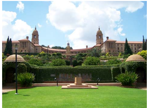
Uniegebouwen - Pretoria - ZA