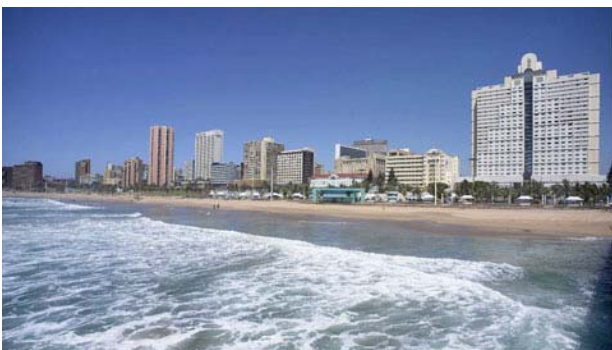
Durban - Marine Parade

Na een bezoek aan Shakadorp met Zoeloe dansen en rondleiding, rijden we verder naar Durban waar we overnachten in een hotel langs de Marine Parade.