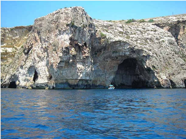
Malta - Blauwe Grot

Zondag 3 mei: bezoek Blauwe grot – avondmaal in restaurant + Malta by night