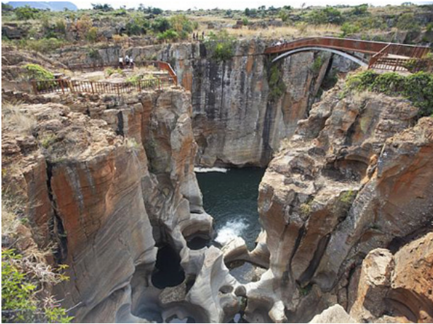
Bourke's Luck - Potholes

Inrijden van het Krugerpark, waar we zullen overnachten in Pretoriuskop .