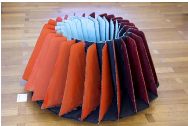
KPSK-prijs - Klein Sculptuur 2011

Vanaf 2011 is gekozen voor de tweejaarlijkse prijs afwisselend schilderkunst - klein sculptuur. In 2015 zijn dus de beeldhouwers terug aan de beurt.