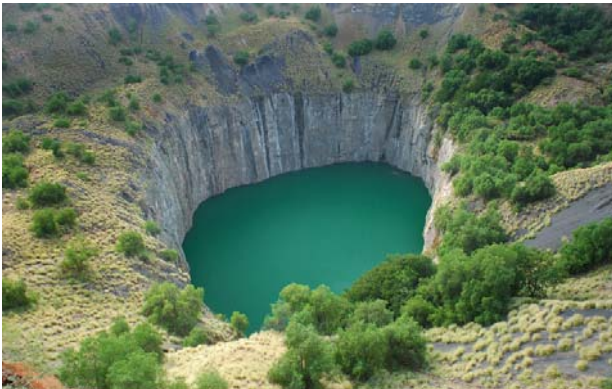
Kimberley - Big Hole

We rijden naar Kimberley met bezoek aan Big Hole en het museum.