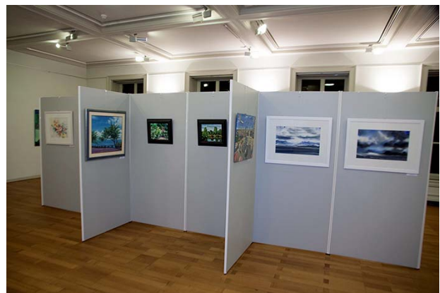
Klassiek Salon 2014